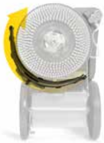
Rotazione del tergipavimento parabolico

L'associazione tra il motore di aspirazione ed il tergipavimento garantisce ottimi risultati di asciugatura.