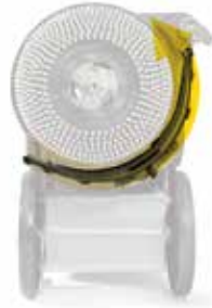
Rotazione nell'altro senso del tergipavimento parabolico