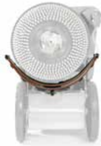
Posizione tergipavimento parabolico a riposo