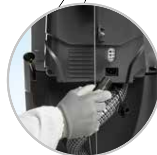
... ricarica! (Versioni a batteria)

Facile nella ricarica delle batterie grazie alla possibilità di avere il caricabatterie a bordo (su richiesta)