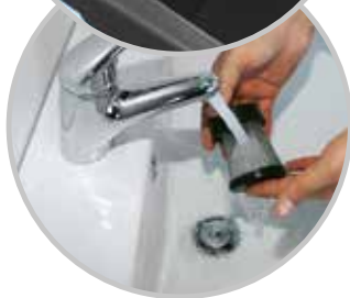
Pulisci il filtro...