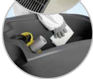
Svuota e sanifica...