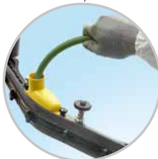
Pulisci il tergipavimento!