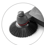
Spazzole laterali regolabili in altezza