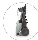
Dimensioni compatte: facile da riporre