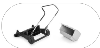
Contenitore rifiuti di grande capacità