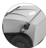
Sistema di bloccaggio del manico pratico e veloce