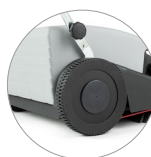
Grandi ruote posteriori