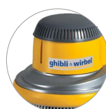
Nuova cover in plastica (L22)