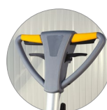
Impugnatura vista fronte