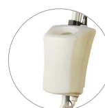
Serbatoio 12 litri (optional)