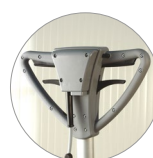
Impugnatura vista retro