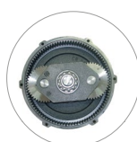
Riduttore a satelliti e planetario (L22)