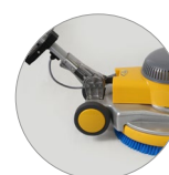
Snodo del manico