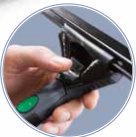
TriLoc meccanismo di sicurezza della guida

Protezione del telaio: per proteggere i telai delle finestre dai graffi. Gli Smart-Clip possono essere facilmente sostituiti a mano o usando un cacciavite.