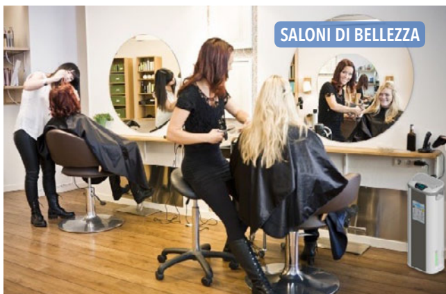
SALONI DI BELLEZZA