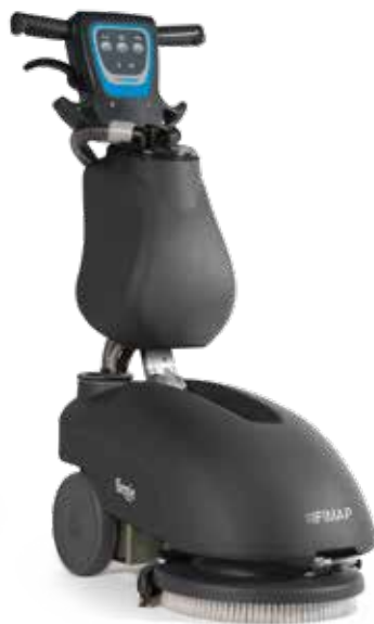
🔋 Genie B